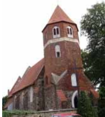
Foto 7. Widok ogólny kościoła w Nowej Wsi Królewskiej od pd.-zach.

Obejrzawszy kościół płużnicki, wyruszamy drogą wojewódzką nr 548 do Lisewa (ok. 6 km). W centrum tej dużej, wzmiankowanej od 1288 r. wsi, patrząc w kierunku jazdy po prawej stronie, na niewielkim, otoczonym murem i zajęтым przez cmentarz wyniesieniu, gotycki, orientowany kościół p.w. Podwyższenia Krzyża Św. i NMP Śnieżnej wzniesiony zapewne w 4 ćw. XIII w. Znacznie przebudowany z fundacji Stanisława i Jana Kostków przez muratora Jana Busadzii (?) w l. ok. 1551 – 1585. Wówczas to m.in. dobudowano masywną, efektownie dekorowaną blendami, opaskowymi fryzami i półszczytami część zach. korpusu wraz z wieżą (Foto 8.). Obiekt następnie wielokrotnie odnawiano. Dziś prezentuje się nam salowa budowla z wyodrębnionym prezbiterium. Wzniesiona z kamienia polnego, łamanego granitu i cegły. Ciekawie ukształtowany szczyt prezbiterium, schodkowy, dekorowany