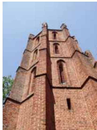
Foto 2. Wieża kościoła w Lembargu, ujęcie od pd.

Oczywiście na przestrzeni wieków wiele z wymienionych kościołów poddawanych było różnorodnym przebudowom. Zasadniczo jednak nie zniekształciły one brył i ogólnego architektonicznego charakteru, choć za to niejednokrotnie pozbawiły obiekty oryginalnego detalu architektonicznego 15 . Często zaś w sposób mniej lub bardziej interesujący wzbogaciły je, stając się cennym świadectwem stosunku do materii zabytkowej w przeszłości. Oczywiście estetyczne walory wspomnianych przekształceń mogą być przedmiotem dyskusji. Zapewne puryści z chęcią usunęliby nawarstwienia, starając się przywrócić „oryginalny”, XIII- czy XIV-wieczny kształt obiektów, tak jak to można w sposób aż nadto dobitny zobaczyć w realizacjach konserwatorskich, którym poddano ostatnio szereg barokowych ołtarzy z kościołów toruńskich (czy też u św. Anny w Radzynie Chełmińskim). Osobiście, mając w pamięci słowa Michela Pastoureau 16 , uważam te wszystkie architektoniczne dodatki za element dodający poszczególnym obiektom uroku i świadczący o ich bogatych, niejednokrotnie tragicznych dziejach. Również z tego względu gotyckie kościoły Ziemi