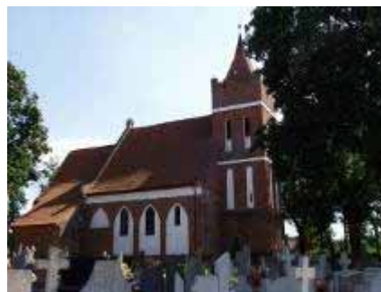
Foto 10. Ogólny widok kościoła w Bobrowie od pn.

Najciekawszym elementem wyposażenia, zasadniczo późnobarokowego i rokokowego, jest znajdujący się w ołtarzu głównym obraz „Matka Boska z Dzieciątkiem i św. Janem