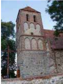
Foto 13. Wieża kościoła w Kruszynach, widok od pn., z podwórca plebanii.

Opuszczamy Kruszyny i udajemy się drogą lokalną na Książki, a następnie – po ok. 1 km – skręcamy w lewo na Brudzawy (łącznie ok. 3 km). We wsi kościół gotycki p.w. św. Andrzeja Apostoła. Orientowany, salowy, prostokątny z zakrystią, kruchtą i wieżą (Foto 14.). W dolnych partiach z kamienia, w górnych ceglany. Surową bryłę ożywia trójkątny szczyt wschodni dekorowany sześcioma sterczynami i trzema blendami umiejscowionymi w centralnych polach szczytu. Jego płynnym przedłużeniem jest szczyt zakrystii, dekorowany trzema niewielkimi fialami i blendą. Całość elewacji wschodniej tworzy w rezultacie harmonijną, choć surową całość (Foto 15.). Wieża kościoła, umiejscowiona w jego zachodniej części, reprezentuje typ dość często spotykany w Ziemi Chełmińskiej. Jest w dolnej partii czworoboczna, a nieco powyżej fryzu wieńczącego korpus płynie przechodzi w ośmiobok.