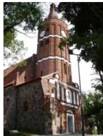
Foto 8. Masyw zach. kościoła w Lisewie