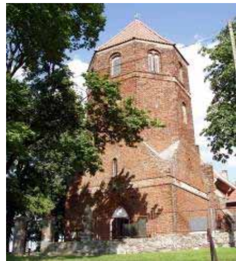
Foto 26. Wieża kościoła w Niedźwiedziu.

Ciekawe wyposażenie, głównie barokowe, jednak z elementami gotyckimi.