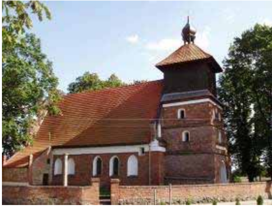
Foto 23. Ogólny widok fary w Radowiskach Wielkich od pn.

Z Wielkich Radowisk na powrót wyjeżdżamy na drogę wojewódzką nr 534. Skracamy w lewo i kierujemy się na Niedźwiedź . Do centrum wsi dojeżdżamy po ok. 3 km. Widoczna z trasy tamtejsza fara p.w. św. Jerzego stoi na otoczonym murem, zajmowanym przez przykościelny cmentarz, opadającym dość stromo ku wschodowi wzgórzu. Aby do niej dotrzeć musimy skręcić w prawo w drogę wojewódzką nr 548 i przejechać nią ok. 100 m. Dwuprzęsłowe prezbiterium świątyni wzniesiono zapewne w końcu XIII, zaś nawę i wieżę w I połowie XIV w. Następnie wielokrotnie przebudowywany (XV, XVII, XIX i XX w.).