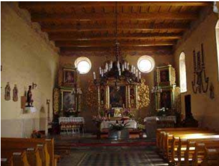
Foto 16. Wnętrze kościoła w Osieczku, typowy przykład gotyckiej budowli salowej przebudowywanej i wyposażanej w późniejszych okresach.

Z Osieczka lokalnymi drogami udajemy się w kierunku południowo-wschodnim do sporej, gminnej wsi Dębowa Łąka (ok. 4 km). Przy drodze do Łobdowa, niedaleko centrum, stoi kościół p.w. śś Piotra i Pawła. Nie należy on może do grona najpiękniejszych i najefektowniejszych w Ziemi Chełmińskiej, zwraca jednak uwagę kilkoma rzeczami. Jest to budowla orientowana, salowa, wzniesiona na przełomie XIII/XIV w., a następnie po zniszczeniach Wielkiej Wojny odbudowana i znacząco przekształcona w początkach XVII w. Uderzający jest kontrast pomiędzy wyjątkowo surową bryłą kamiennego korpusu, którego północna elewacja w ogóle pozbawiona jest otworów okiennych, a wysokim czternastowiecznym (choć nieznacznie przekształconym w w. XVII) schodkowym, ceglany szczytem wschodnim oraz monumentalną, zbudowaną na planie kwadratu wieżą. Szczyt wschodni dekorowany jest pięcioma blendami, sześcioma ustawionymi przekątnie sterczynami oraz znajdującymi się między nimi trójkątnymi szczycikami. Umieszczona od zach. wieża posiadają oryginalną, powstałą głównie w pocz. XVII w. artykulację. Jej dolną, całkowicie kamienną kondygnację zdobi wyłącznie ostrołukowy, wykonany z profilowanej cegły, uskokowy portal. Wyższa kondygnacja posiada dekorację składającą się z trzech w każdej elewacji blend, zaś dwupiętrową najwyższą kondygnację zdobią wysokie wnęki zamknięte zdwojonymi łukami. Całość wieńczy atyka i wysoka ceglana iglica. (Foto 17. zob. też foto 1.)