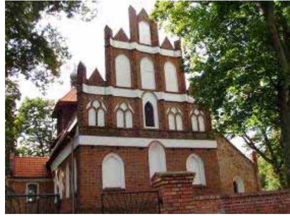
Foto 24. Wschodnia elewacja kościoła w Radowiskach Wielkich.

Kościół w Niedźwiedziu jest jednym z ciekawych i wcale licznych przykładów łączenia przez mistrzów budowlanych kamienia, z którego wzniesiono jego dolne partie, oraz cegły służącej w znacznej mierze jako materiał do wykonania elementów dekoracyjnych (szczyt wschodni, portale) (Foto 25). Na uwagę zasługuje też dość typowa, lecz ciekawa, umiejscowiona od zachodu wieża, o dolnej kondygnacji kwadratowej, a górnej ośmiobocznej (Foto 26).