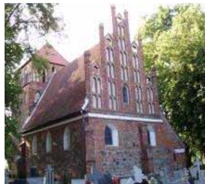
Foto 18. Widok fary w Łobdowie od pd.-wsch..

Co się tyczy monumentalnej, wzniesionej na planie zbliżonym do kwadratu wieży, mamy do czynienia z obiektem niewątpliwie przebudowywanym, zapewne z powodu katastrofy budowlanej, dlatego nietypowym. Od pn-wsch wieżę wzmacnia wydatna, pięciuskokowa przypora. Całość uzupełniają nieregularnie rozmieszczone