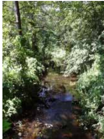
Foto 11. Lutryna u stóp wzgórza, na którym stoi lembarska fara.

Zwraca też uwagę – można powiedzieć – „klasyczny” w formie, pięciodzielny szczyt wschodni, schodkowy, ozdobiony ostrołukowymi blendami i sterczynami. Wnętrze dekorowane częściowo zachowaną polichromią z ok. 1700 r. (sklepienie korpusu i zachodnia ściana). Wyposażenie głównie barokowe. W jego skład wchodzi również umieszczona w głównym ołtarzu późnogotycka figura Matki Boskiej z Dzieciątkiem (ok. 1520 – 1530 r.) oraz krucyfiks z przełomu XIV/XV w. (KZSP, t. XI.2, s. 39 – 42. Zob. też TST).