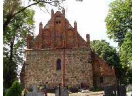
Foto 15. Harmonijna elewacja wsch. kościoła w Brudzawach.

Wyposażenie świątyni, głównie XVIII i XIX w., nie jest szczególnie godne uwagi (KZSP, t. XI.2, s. 24 – 25. Zob. też TST).