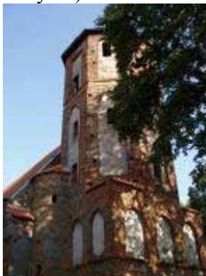
Foto 20. Widok zach., wieżowej partii kościoła w Kurkocinie od pn.

uwagę zwraca umieszczona od zachodu wieża, w dolnej partii kwadratowa, w górnej ośmioboczna. W porównaniu z innymi tego typu wieżami jest ona wysmukła i posiada ciekawą dekorację, na którą składają się z reguły ostrołukowe blendy (za wyjątkiem najwyższej kondygnacji), fryz opaskowy oddzielający najwyższą kondygnację wieży oraz nierównomiernie rozmieszczone otwory okienne. W północno-zachodnim narożniku wieży znajduje się wtopiona w elewację cylindryczna wieżyczka schodowa przykryta stożkowym daszkiem, (Foto 20 – 21) zaś w południowej elewacji korpusu efektowny uskokowy, wykonany z profilowanej cegły, zamurowany portal ostrołukowy (Foto 22.). W ogóle w kościele tym zachował się cały zespół ostrołukowych portali (pod wieżą, w północnym odcinku ściany zachodniej, czyli w wejściu na chór i wieżę, uskokowy, otynkowany do zakrystii).