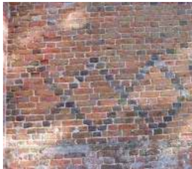
Foto 5. Rombowa, wykonana z zendrówki dekoracja pd. ściany nawy kościoła w Okoninie.