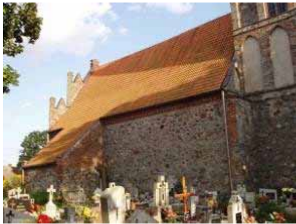
Foto 1. Pn. elewacja nawy kościoła w Dębowej Łące

Elementami, które pozwalały na wykazanie się architektom i muratorom inwencją były za to wieże i szczyty. Oglądając je – mówię tutaj o swoich odczuciach – trudno nie podziwiać