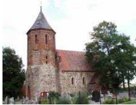
Foto 14. Ogólny widok kościoła w Brudzawach od pd.-zach.