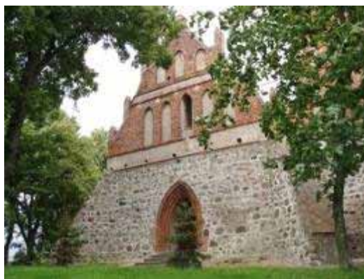
Foto 3. Zachodnia elewacja kościoła w Wabczu.