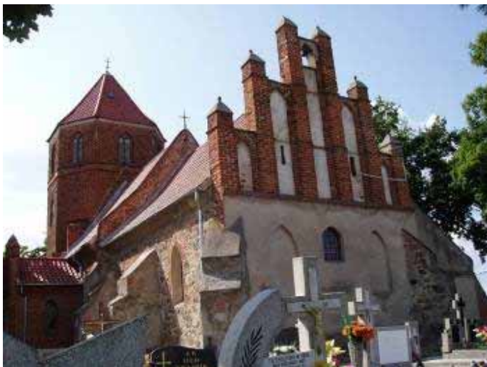
Foto 25. Widok kościoła w Niedźwiedziu od pd.-wsch.

Kościół w Niedźwiedziu jest jednym z ciekawych i wcale licznych przykładów łączenia przez mistrzów budowlanych kamienia, z którego wzniesiono jego dolne partie, oraz cegły służącej w znacznej mierze jako materiał do wykonania elementów dekoracyjnych (szczyt wschodni, portale) (Foto 25). Na uwagę zasługuje też dość typowa, lecz ciekawa, umiejscowiona od zachodu wieża, o dolnej kondygnacji kwadratowej, a górnej ośmiobocznej (Foto 26).