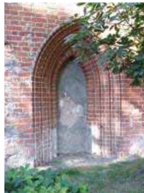
Foto 22. Zamurowany portal pd. fary w Kurkocinie.

Dominantę skromnego, ostatnio na nowo otynkowanego i pomalowanego na biało wnętrza stanowią barokowe ołtarze (KZSP, t. XI.19, s. 6 – 7. Zob. też TST).