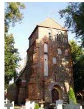
Foto 19. Wieża łobdowskiego kościoła.

otwory okienne i blendy, oraz niski czterospadowy, kryty dachówką dach. (Foto 19)