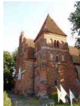
Foto 6. Widok od pd. na wieżę okonińską świątyni

Podsumowując krótką notkę o kościele okonińskim pozwolę sobie stwierdzić, że w mojej opinii jest to urocze i niezwykle gotycko – manierystyczne puzderko.