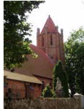
Foto 12. Widok świątyni w Lembargu od pd-wsch.