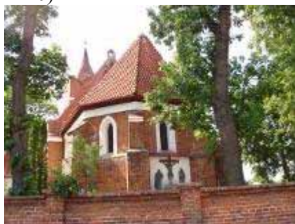
Foto 9. Widok trójdzielnie zamkniętego prezbiterium kościoła w Bobrowie od wsch.

Sama świątynia, orientowana, zbudowana z cegły na podmurówce z głazów narzutowych, należy do najstarszych w Ziemi Chełmińskiej. Jej zamknięte – co jest rozwiązaniem relatywnie rzadkim – trójbocznie 24 , oszkarpowane prezbiterium oraz częściowo nawę wzniesiono ok. 1260 r. Rozbudowana w 1 poł. XIV w., w 1 poł. XVII w. uzyskała w 1 poł. XVII w. murowaną wieżę. Południowa ściana prezbiterium posiada ciekawą dekorację składającą się z ostrołukowego okna z podwójnym uskokiem flankowanego blendami, zamkniętymi półkolistymi, spłaszczonymi łukami. Wieża jest interesującym przykładem stosowania przetworzonych form nawiązujących do gotyku w XVII w. Zwieńczona attyką i ceglana iglicą, jest podzielona fryzem opaskowym na kondygnacje dekorowane blendami. (Foto 9 – 10)