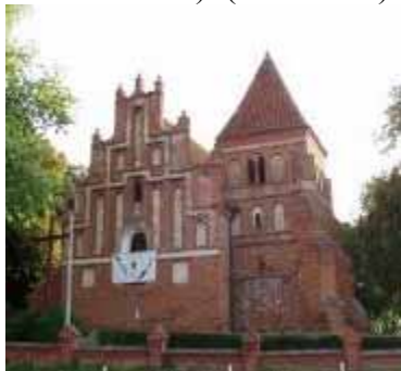
Foto 4. Wsch. elewacja fary w Okoninie.

We wnętrzu znajdują się polichromie gotyckie (XIV i XV w.) oraz barokowe (XVIII w.). Poza tym, bogate wyposażenie, w przeważającej mierze barokowe (KZSP, t. XI.7, s.48 – 52. Zob. też TST). (Foto 4 – 6).