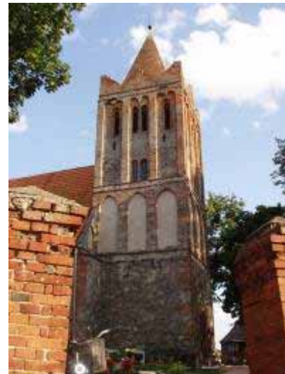
Foto 17. Wieża kościoła w Dębowej Łące od pn.

Wyposażenie kościoła pochodzi głównie z XVII i XVIII w. Uwagę zwracają szczególnie manierystyczny, ołtarz główny z 1615 r. (przekształcony nieco w pocz. XVIII w.) oraz dwa ołtarze boczne.